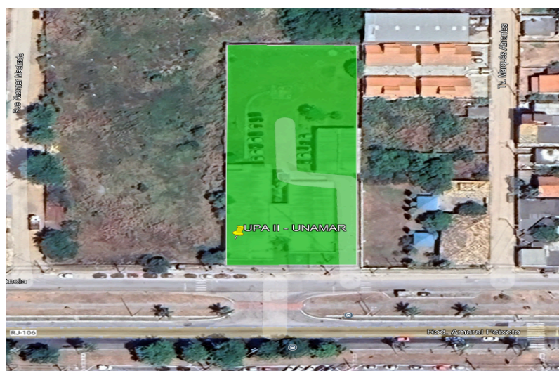
Figura 1 - Localização da UPA II

Estudo Técnico Preliminar elaborado pelo Setor de Engenharia da Secretaria Municipal de Saúde de Cabo Frio para atender a etapa da fase de planejamento e apresentar os devidos estudos para a contratação de solução para a necessidade de reforma e ampliação da unidade de pronto atendimento - UPA II, localizado na Rodovia Amaral Peixoto, 6701 - Unamar, Cabo Frio - RJ.